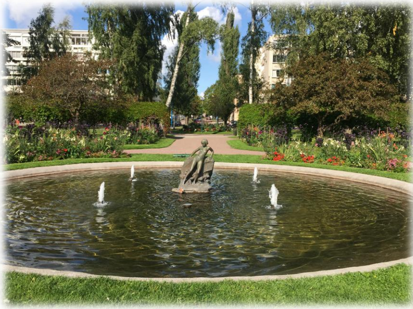
Vi svingte innom en tur i Sunne