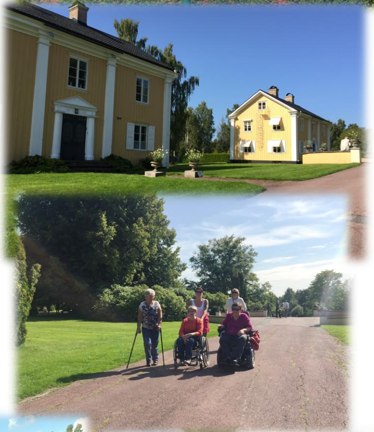
Vi hadde også en tur til Arvika og her trilla vi rundt Stadsparken blant annet