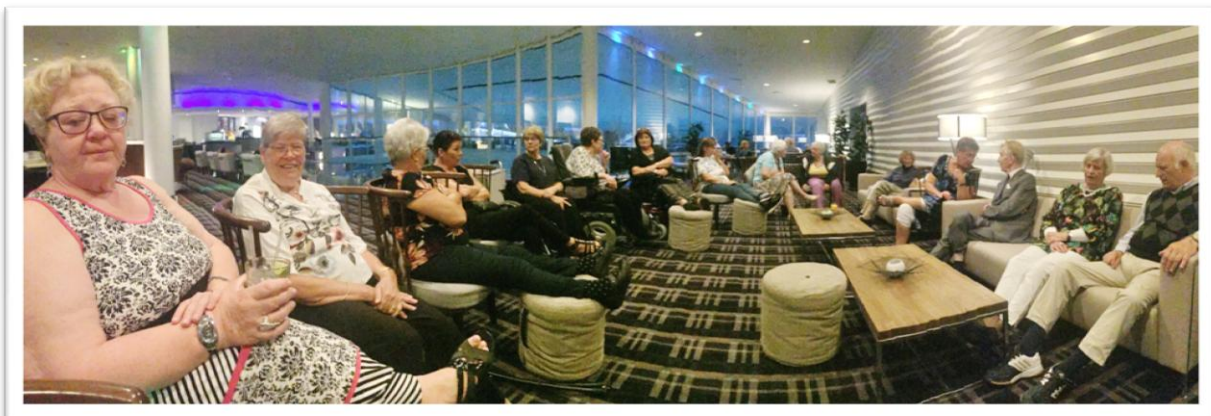
Så er vi klar for å reise hjem, men først en samling med gjengen